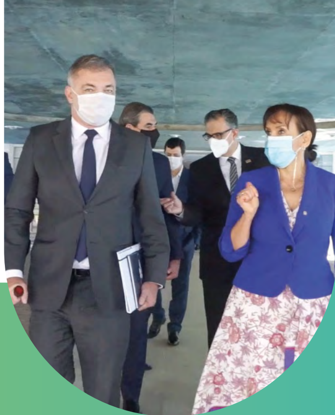
Prefeitos do Conectar discutem avanços na saúde com Socorro Gross, representante da Organização Pan-Americana de Saúde (Opas) no Brasil.

O Consórcio Conectar estabelece via administrativa legítima e segura para o recebimento de doações da iniciativa privada. Parcerias firmadas recentemente com empresas como Natura & CO e Ifood resultaram na doação de mais de R$ 4 milhões que serão revertidos em insumos e medicamentos para a rede de municípios consorciados.